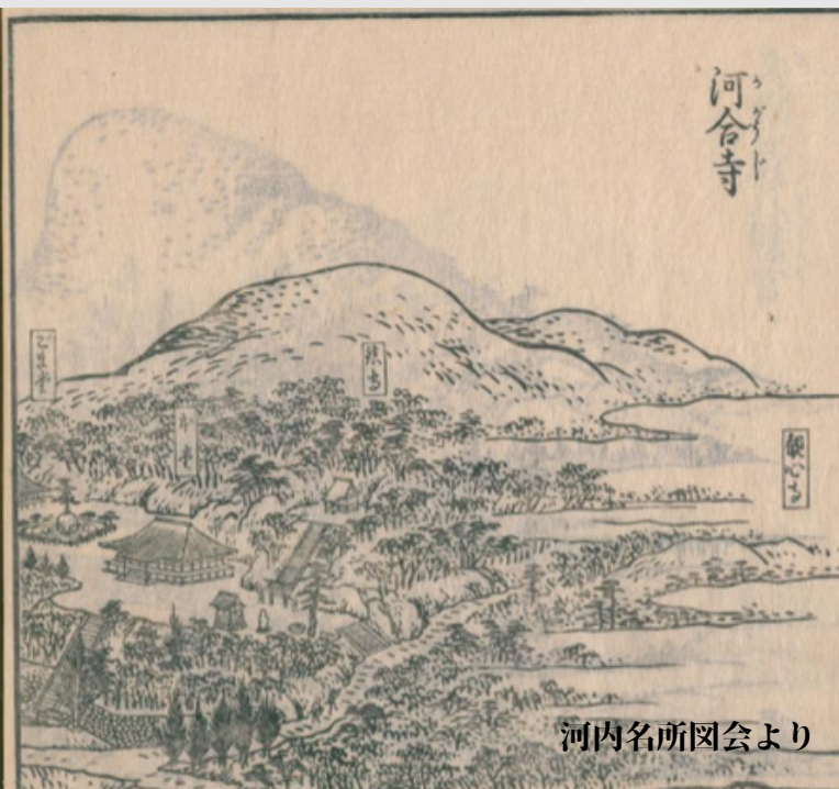
河内名所図会より