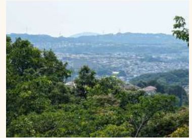
丸山展望台からのパノラマ風景