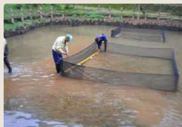
【ザリガニ防護柵設置】

藻は、蓮の新芽や花芽に絡みつき、葉が展 開できない、または曲りの原因となるので 除去します。 2013.9.20