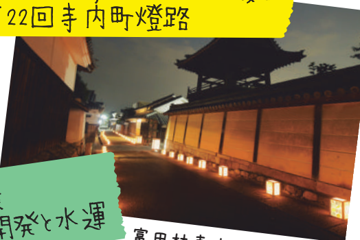
富田林寺内町およびその周辺